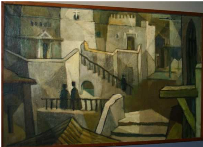
Мусейон в Александрии Египетской

Сподвижник Александра Македонского талантливый полководец и умный правитель Птолемей 1 Сотер создал в Александрии Египетской Мусейон. Создание в начале III века до н.э. Мусейона – величайшая заслуга перед человечеством Птолемея.