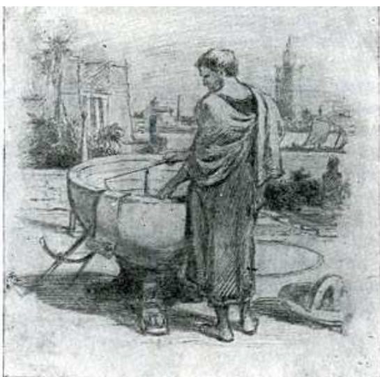
Эратосфен проводит наблюдения для определения размеров Земли.

Александрийский мусейон был и исследовательским центром, и величайшим музеем древности (от слова «мусейон» и возникло слово «музей»), с парком, ботаническим садом, зверинцем. При нем была обсерватория, оборудованная астролябиями, глобусами, телескопами. Быстрому развитию научных исследований способствовало щедрое финансирование. Средств не жалели, и это создавало чрезвычайно благоприятные условия для творческой деятельности. Занимаясь исследованиями, ученые имели возможность ежедневно встречаться за совместными трапезами и на прогулках в прекрасных садах дома муз. У них была исключительная возможность обмениваться опытом, советоваться, находить истину в споре и комплексно решать научные проблемы.