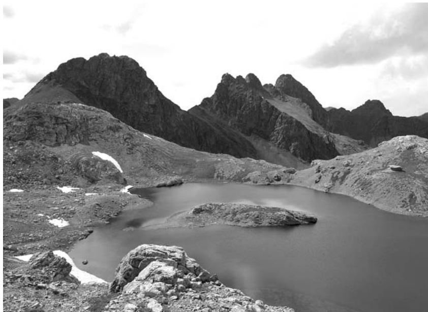
Рис. 11. Местообитание Carabus boeberi glebi ssp. n., Карачаево-Черкесская Республика, хр. Абишира-Ахуба, озеро между перевалами Агур и Мылгвар, 2785–2830 м н.у.м.