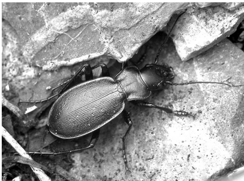
Рис. 10. Carabus boeberi glebi ssp. n. в природе, Карачаево-Черкесская Республика, хр. Абишира-Ахуба, озеро между перевалами Агур и Мылгвар.