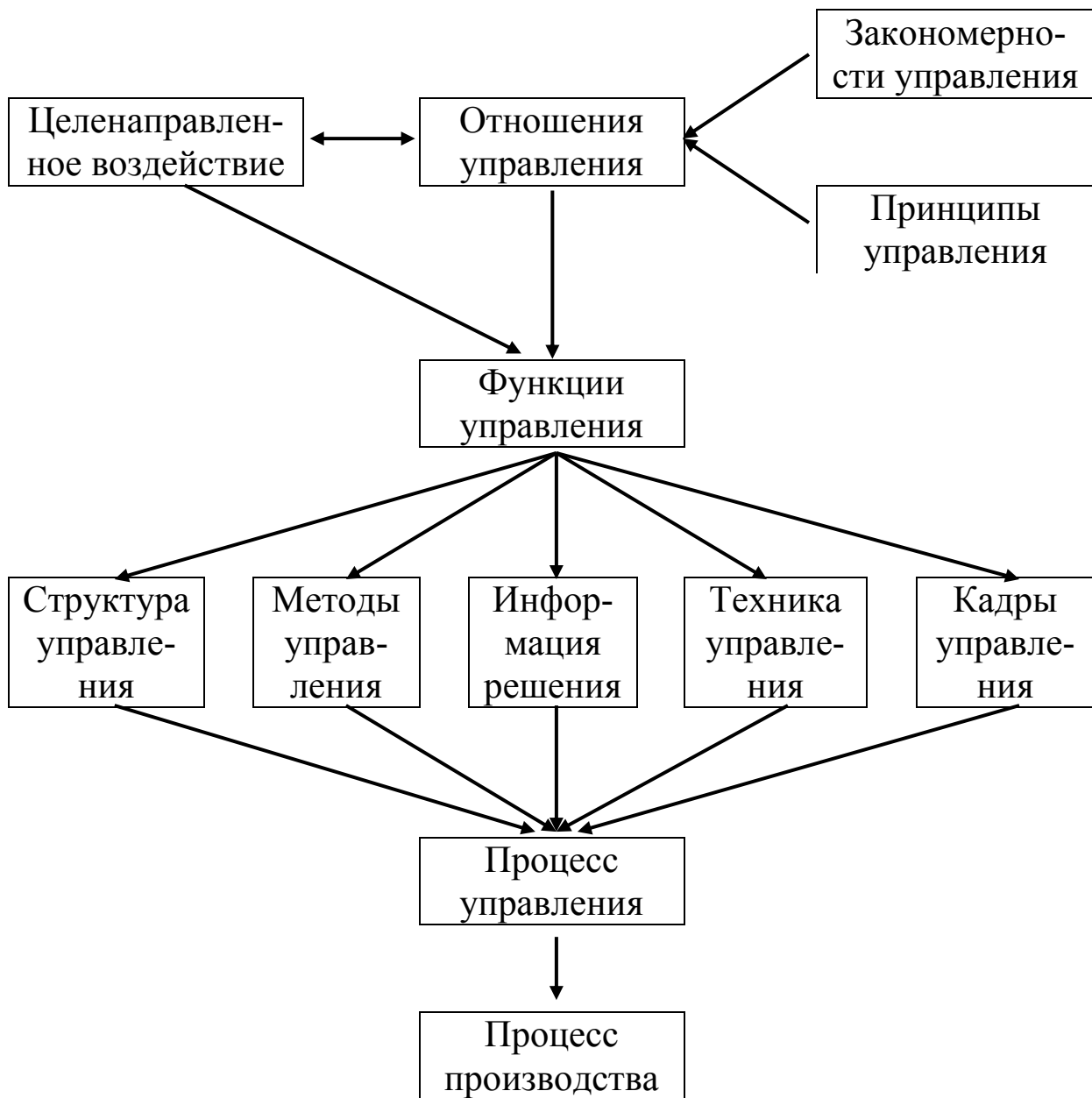
Рисунок 1 – Схема, определяющая место категории «функции управления» среди основных категорий науки управления