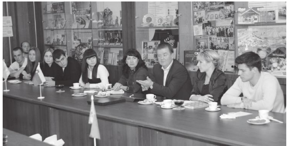
Встреча студенческого актива с ректором

С одной стороны, у нас большой удельный вес студентов, обучающихся по направлениям предприятий, для которых вопрос прохождения практики уже решен. Помимо этого мы заключаем договоры о сотрудничестве с ведущими предприятиями и учреждениями различных отраслей, включая договоры о создании филиалов кафедр на базе предприятий. С другой – несколько лет назад было принято решение о возможности организации практического обучения на базе непосредственно университета. Были созданы российско-датский учебно-производственный комплекс «Пятачок», учебные центры