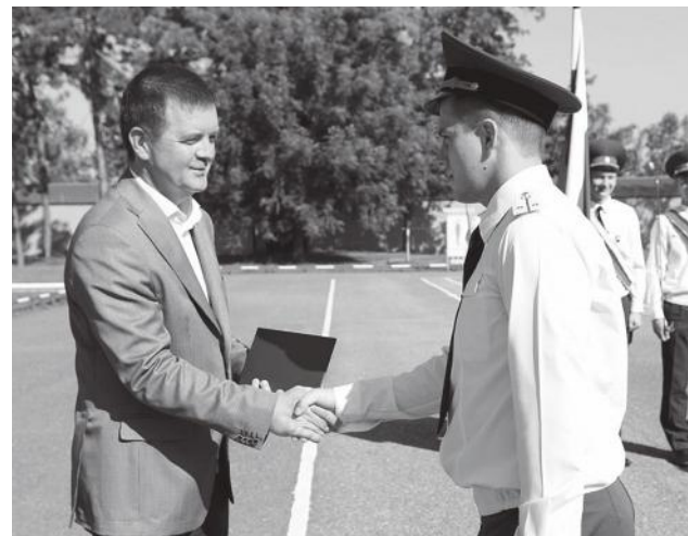
Вручение дипломов выпускникам УВЦ

В конце мероприятия выпускники по традиции подбросили в воздух десятки монет – своеобразный салют в честь окончания учебы. Со-