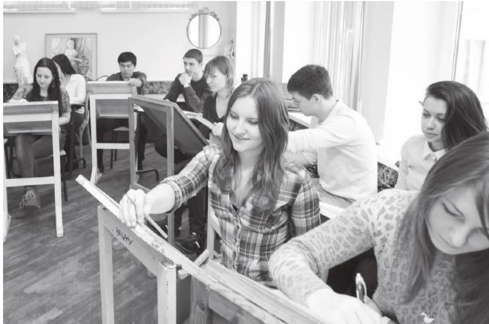
Студенты инженерно-строительного факультета на занятии

– Есть три профессии, которые популярны всегда. Это врач, учитель и строитель. Все наши выпускники трудоустроены, проблемы с трудоустройством выпускников строительного факультета нет и никогда не было. На нашем факультете два профиля подготовки – «промышленное и гражданское строительство» и «проектирование зданий». В прошлом году мы открыли новую специальность – «строительство уникальных зданий и сооружений» со специализацией «строительство высотных зданий и большепролетных конструкций», обучение шесть лет и только очное, квалификация – специалист. В последние годы в России практикуется уровневое обучение: бакалавриат и магистратура. Бакалавриат – это первый уровень высшего образования. Готовит работников стройки, линии, технических специалистов. В магистратуре ведется обучение по двум специализированным, аннотированным программам – «Теория и проектирование зданий и сооружений» и «Техническая эксплуатация и реконструкция зданий и сооружений». Это второй уровень высшего образования – будущие работники НИИ, сотрудники вузов. Выпускники также имеют воз-