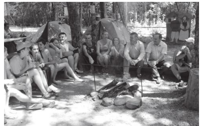
«Регион 93» – волонтерская смена

Действительно, более половины глав муниципальных образований нашего края имеют диплом нашего вуза, а среди руководителей и специалистов АПК края более 80 процентов наших выпускников. Качество выпускаемых специалистов – главный показатель работы любого