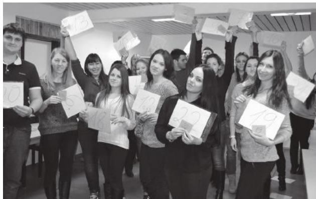
На праздновании Дня молодежи в Германии

12 августа студенты из разных уголков планеты в 15-й раз отмечали свой ежегодный праздник – День молодежи.