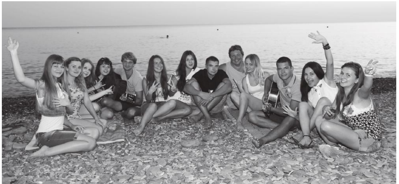
Студенты учетно-финансового факультета КубГАУ

Многие девушки работают горничными. Им нужно со-