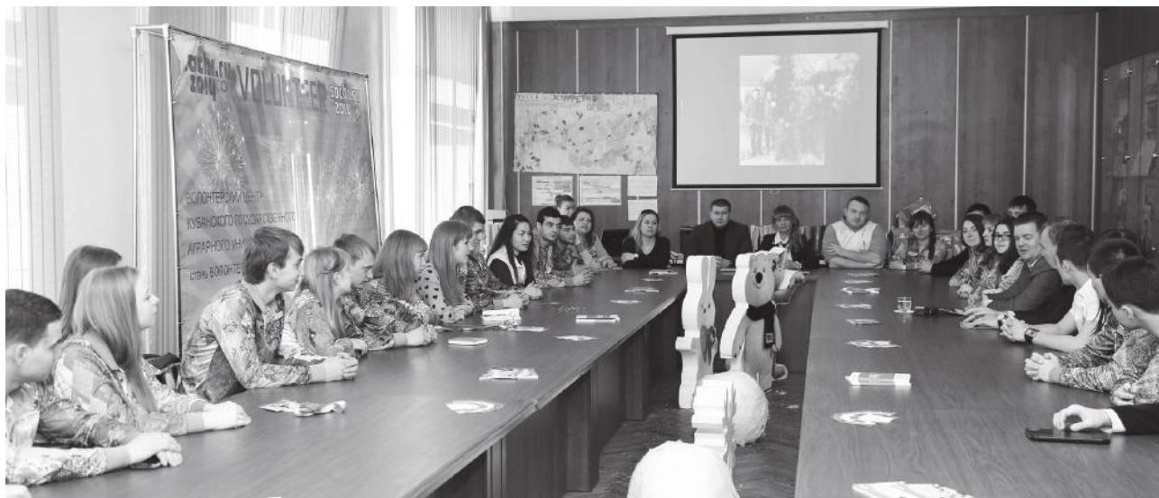
Обмен впечатлениями после Сочинской Олимпиады

– Планы должны быть всегда. Если нет планов, значит, мы не думаем о развитии вуза. Сегодня наш университет – мощный комплекс.