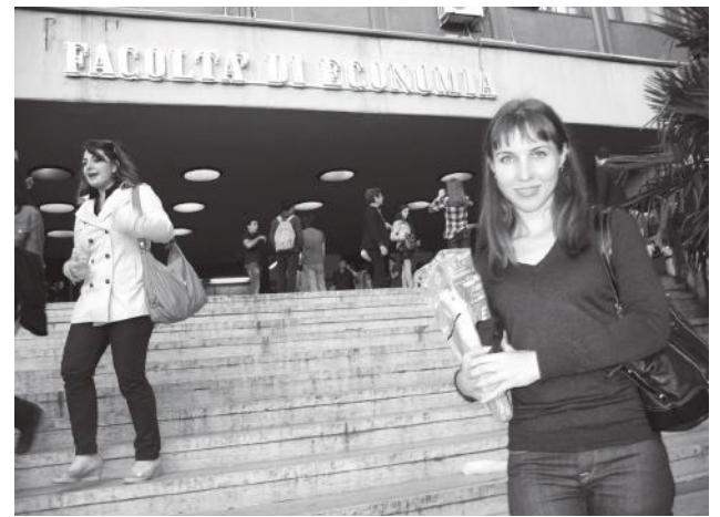
Уздания факультета экономики

Корр. – Много ли наших студентов и аспирантов в университете La Sapienza?