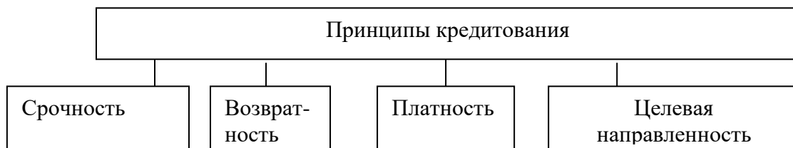
Рисунок А.3 – Основные принципы кредитования

Иллюстрации каждого приложения обозначают отдельной нумерацией арабскими цифрами с добавлением перед цифрой обозначения приложения, например – «Рисунок А.3».