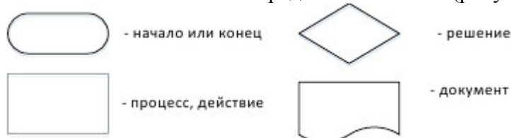
Рисунок – Обозначения основных блоков блок-схемы

Основные символы представлены ниже (рисунок).