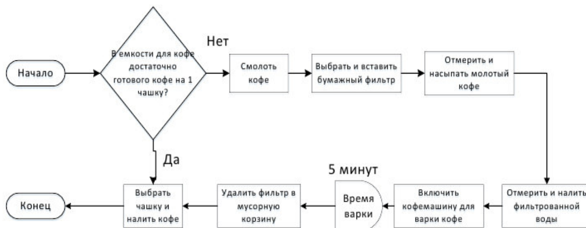
Рисунок – Блок-схема процесса приготовления кофе

Пример блок-схемы процесса приготовления кофе приведен на рисунке.