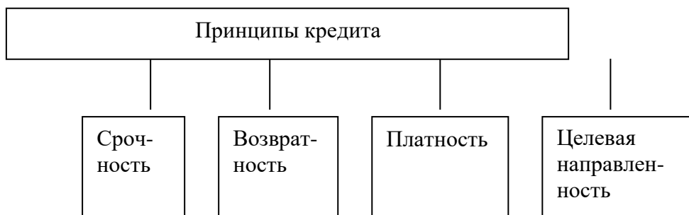
Рисунок А.3 – Основные принципы кредитования

Иллюстрации каждого приложения обозначают отдельной нумерацией арабскими цифрами с добавлением перед цифрой обозначения приложения, например - «Рисунок А.3».