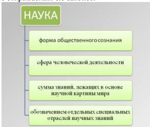
Рисунок 1 – Интерпретации термина «наука»

Непосредственные цели науки – описание, объяснение и предсказание процессов и явлений действительности на основе открываемых ею законов.