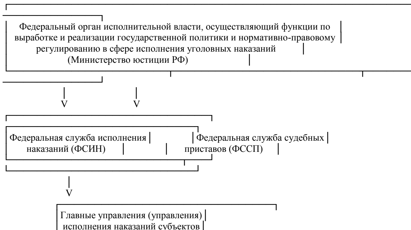
Схема 1. УГОЛОВНО-ИСПОЛНИТЕЛЬНАЯ СИСТЕМА РОССИИ