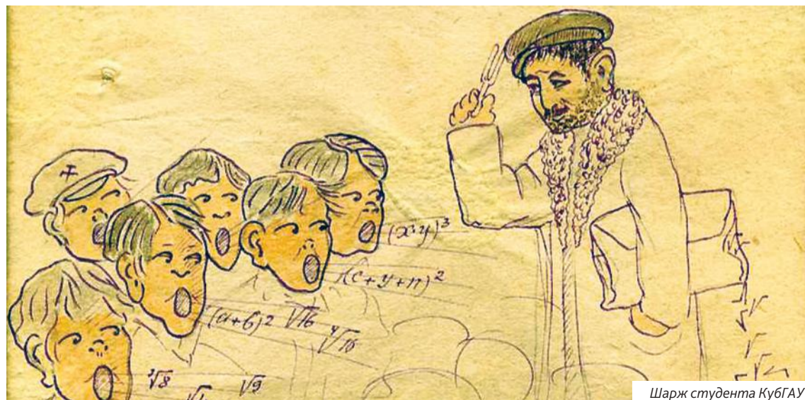
Шарж студента КубГАУ