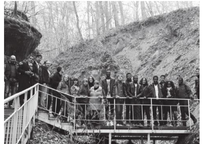
Ребята познакомились с историей Горячего Ключа