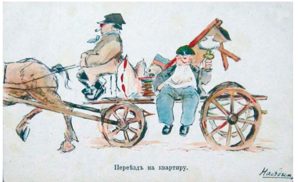
Перебзд на квартиру.