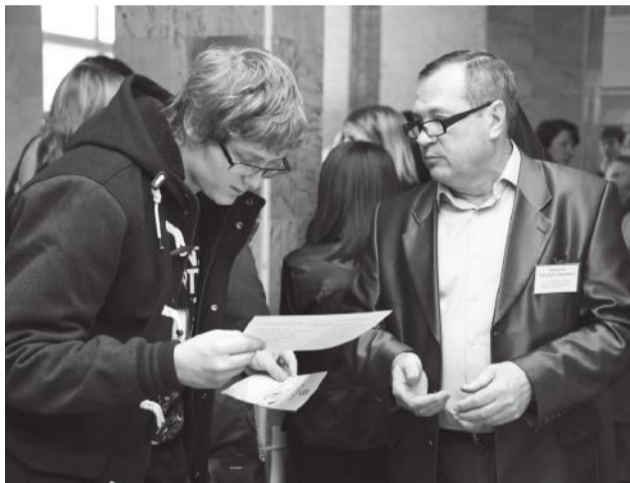
Консультанты университета отвечали на любые вопросы