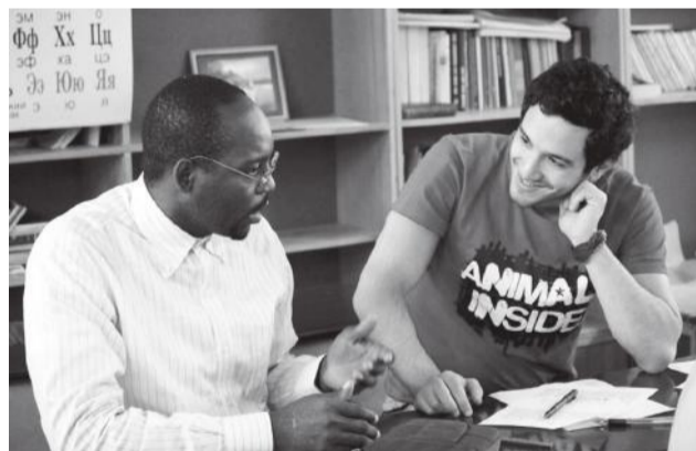
Время проведения стажировок – зима и лето

Существуют стипендиальные программы, такие как Erasmus Mundus, которые