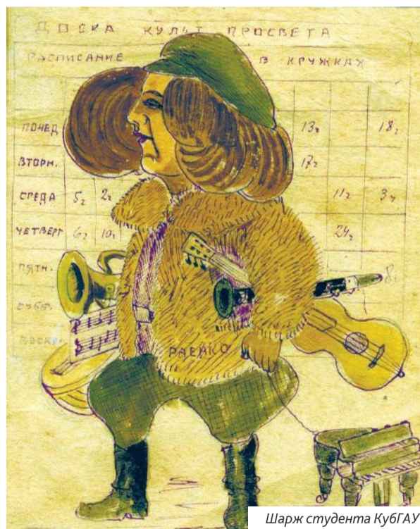
Шарж студента КубГАУ