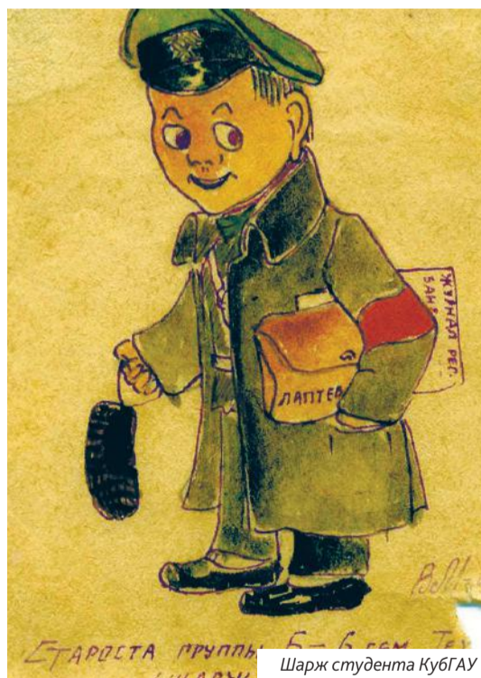
Шарж студента КубГАУ