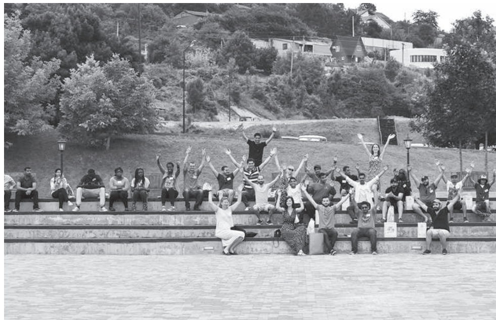
Подготовительное отделение на совместном выезде

В настоящее время ведется сотрудничество не только с вузами России, но и других стран. Поддерживаются связи с иностранными посольствами на территории РФ, а также с российскими консульствами в разных странах, например в Бурунди, Конго, Кипре, Словении, Израиле, Индонезии, Индии и других. Подготовительное отделение КубГАУ