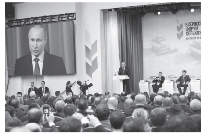
Владимир Путин провел пленарное заседание в актовом зале КубГАУ

тетских проектах, в работе задействовано более 3000 волонтеров. Самым ярким событием для ребят стал чемпионат мира по футболу, более 120 добровольцев вуза работали на его мероприятиях в Ростове-на-Дону, Сочи, Санкт-Петербурге и Краснодаре. Для Волонтерского центра КубГАУ такое масштабное мероприятие мирового значения является