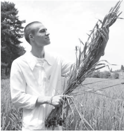
Практика наших студентов проходит на базе наших учебно-опытных хозяйств

Кубанский государственный аграрный университет по праву можно назвать уникальным, ведь большинство студентов на вопрос, почему они выбрали для обучения наш вуз, отвечают, что влюбились в территорию с первого взгляда, и это независимо