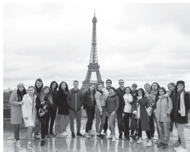
Париж. Экскурсионная программа в рамках стажировки в Германии

Как правило, определенный вид взаимодействия с зарубежными партнерами выражается в конкретных проектах на факультетах. Например, совместные заявки на грант фонда ERASMUS+, благодаря которым реализуется обмен студентами и преподавателями между вузами, особо это касается сотрудничества с Португалией и Германией. Ежегодно на семестровое обучение (академическое или практическое) ребята отправляются в эти страны, а преподаватели повышают свою квалификацию по читаемым