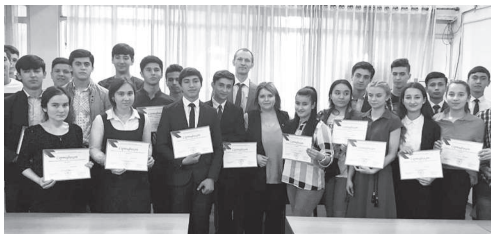
Участники олимпиады в Таджикистане

В первом этапе олимпиады приняли участие 250 человек, желающих поступить в наш вуз. Не все прошли во второй этап, лишь 94 участника отлично справились с заданиями. По итогам двух этапов олимпиады 17 конкурсантам