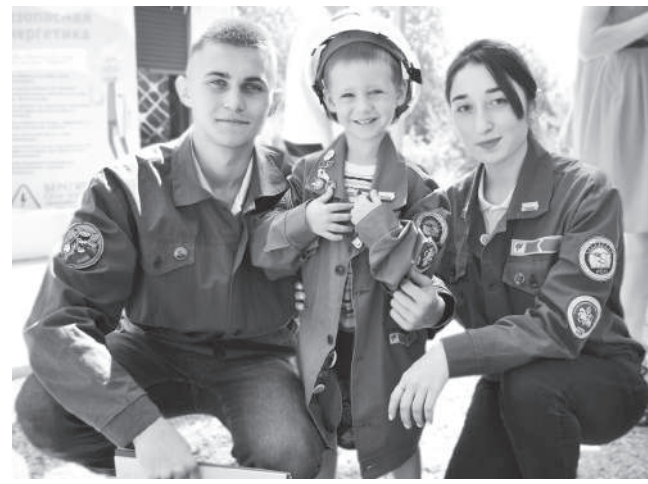
Студенческий отряд «Энергия Кубани» в детском саду рассказывает о пожарной безопасности

Волонтерский центр Кубанского ГАУ за время своего существования стал одним из лучших на Кубани. Наши волонтеры только за последний год участвовали в 8 федеральных, 47 краевых, 83 городских и 42 универси-