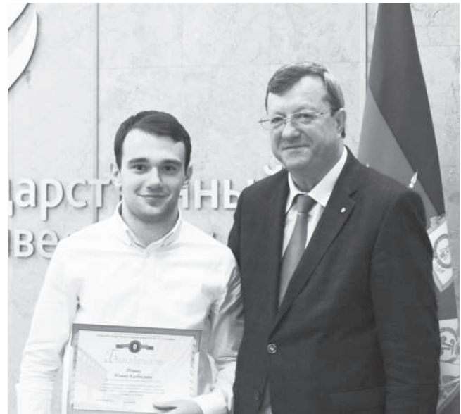
Каждому участнику Зимней универсиады вузов Минсельхоза была вручена благодарность от ректора