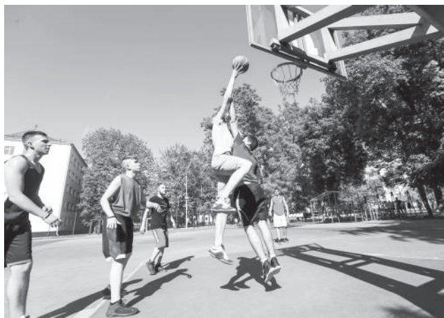
Внутренние соревнования – хороший стимул для больших побед

Тренер, чтобы собрать лучшую сборную, сам ездит по среднеобразовательным и спортивным школам, случалось, что некоторых ребят он тренировал еще в школьном возрасте. И эти ребята поступают в Кубанский ГАУ получать профессию, а также продолжить свой путь к достижениям в спорте. Иногда старшеклассники сами приходят и просят к тренеру на занятия сборной команды, так как планируют поступать в наш университет. И если спортсмен действительно способный, а тем более если кандидат или мастер спорта, его допускают на занятия. Зная команду и своего тренера, абитуриент заинтересован поступать именно в наш вуз. Тем более с условиями, созданными для спорта, он уже успел познакомиться, а условия у нас действительно лучшие. Если говорить о пловцах, то очень много детей, которые ходят занимать-