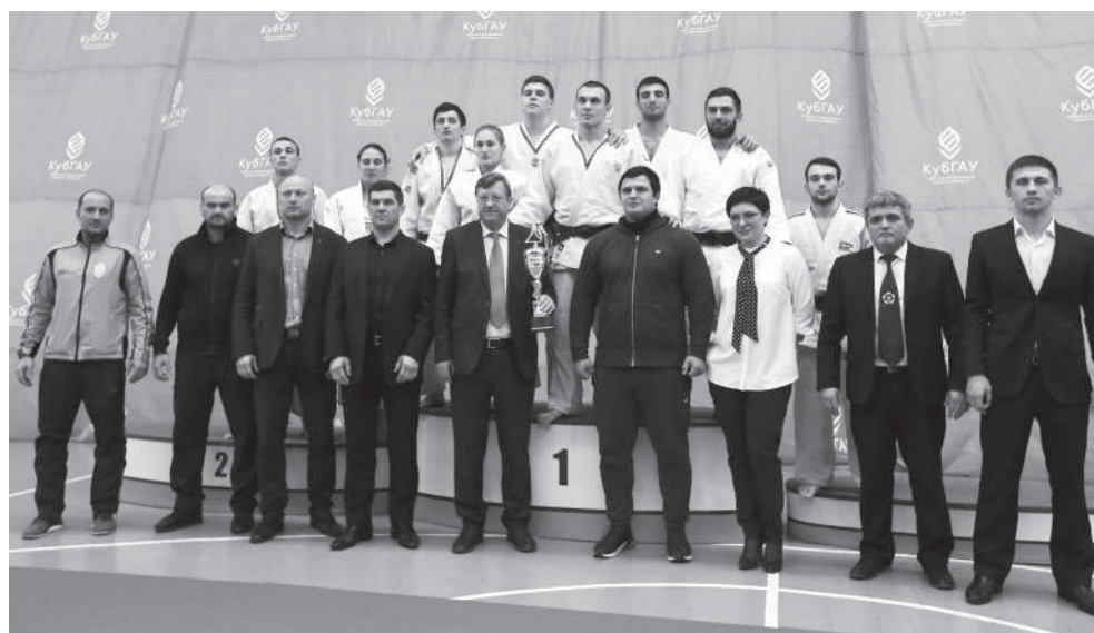
После награждения на чемпионате по дзюдо в рамках IX универсиады вузов Минсельхоза

94% студентов очной формы обучения посещают учебные занятия – это 8000 человек