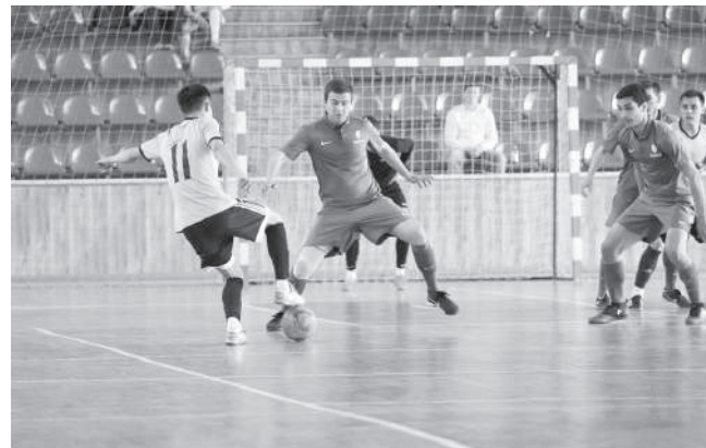
Футбол – один из любимых видов спорта Кубанского ГАУ

- Наши студенты всегда достойно выступали в