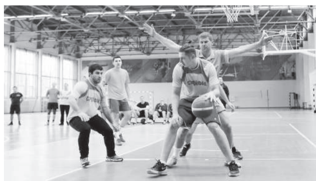
Сотрудники КубГАУ с удовольствием участвуют в спартакиаде «Здоровье»

В течение 18 дней первенство оспаривали 18 команд