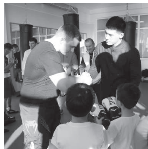
К Дмитрию Биволу выстроилась очередь за автографами

– Я все время провожу параллели между спортом и жизнью: свои спортивные ситуации проецирую на жизнь. Чтобы в боксе придавить соперника в угол, иногда нужно сделать два шага назад, чтобы потом уже дальше подавлять. Также и в жизни – иногда нужно уступить кому-то или чему-то, чтобы потом достигнуть своей цели, – делится своим опытом чемпион мира Дмитрий Бивол.