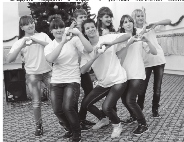
Группа студентов КубГАУ