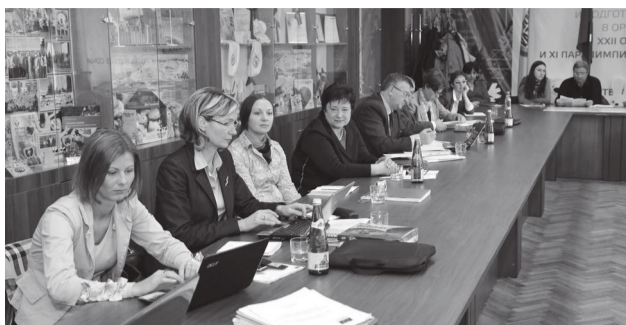
Участники программы «Темпус»

Ученые КубГАУ получили право участвовать в очередном глобальном проекте программы «Темпус». Они будут работать над темой «Развитие и применение программ для магистров в области пищевой безопасности, производства и маркетинга пищевых продуктов в России и Казахстане».