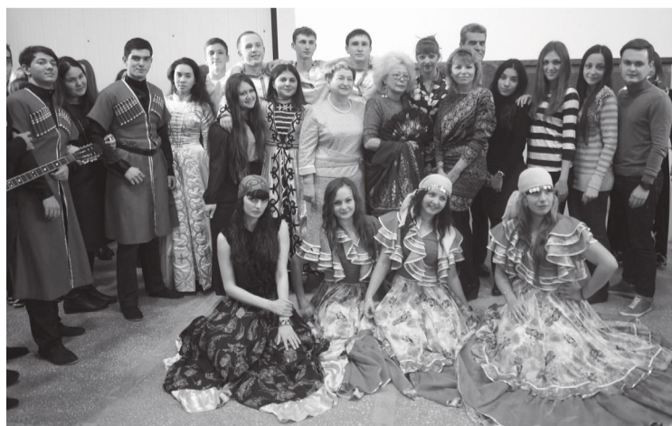
Организаторы конференции со студентами

Прошла межфакультетская студенческая конференция «Менталитеты народов мира в правовом поле». Активное участие в ней приняли студенты первого курса юридического факультета.