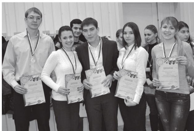
Победители - команда «007»

Завершилась конференция состязанием команд в брейн-ринге. После того как ребята представили презентации своих команд, им предстояло