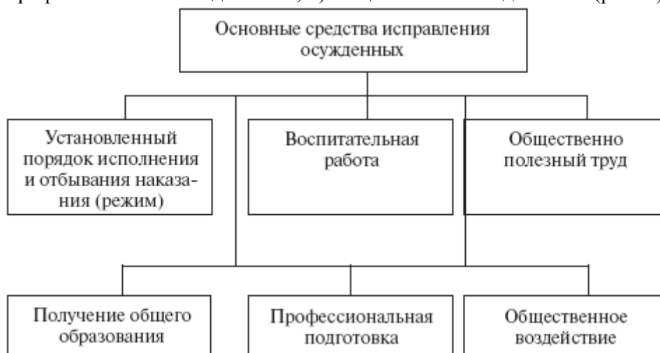
Рис. 5. Основные средства исправления осужденных

В соответствии с ч. 2 ст. 9 УИК РФ к основным средствам исправления относятся: 1) установленный порядок исполнения и отбывания наказания (режим); 2) воспитательная работа; 3) общественно полезный труд; 4) получение общего образования; 5) профессиональная подготовка; 6) общественное воздействие (рис. 5).