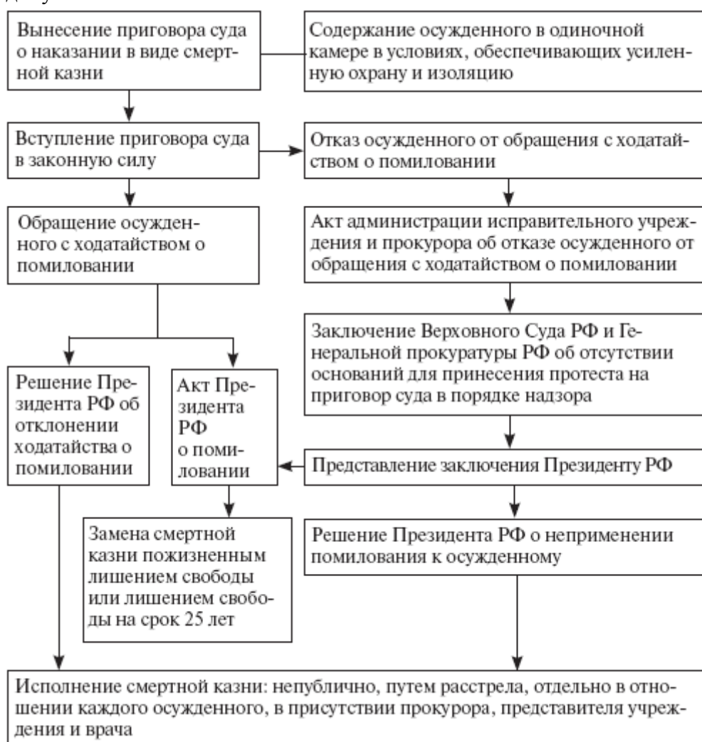
Рис. 10. Порядок исполнения наказания в виде смертной казни

письменной форме. Ходатайство о помиловании регистрируется администрацией учреждения или органа, исполняющего наказание, в специальном журнале учета ходатайств о помиловании в день его подачи. После чего ходатайство направляется администрацией учреждения в территориальный орган Минюста России в субъекте РФ не позднее чем через 20 дней со дня его подачи. К ходатайству о помиловании администрацией учреждения прилагаются необходимые документы. Администрация учреждения уведомляет осужденного о направлении ходатайства о помиловании в территориальный орган юстиции под расписку на копии соответствующего сопроводительного письма. Отказ в направлении ходатайства о помиловании не допускается.