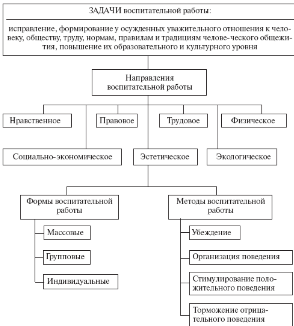
Рис. 9. Основные задачи, направления, формы и методы воспитательной работы с осужденными к лишению свободы

Физическое воспитание осужденных включает в себя проведение различных физкультурно-массовых и спортивных мероприятий. Оно направлено не только на организацию свободного времени осужденных, но и на выработку умений при помощи физической нагрузки поддерживать организм в хорошем состоянии во время отбывания лишения свободы.