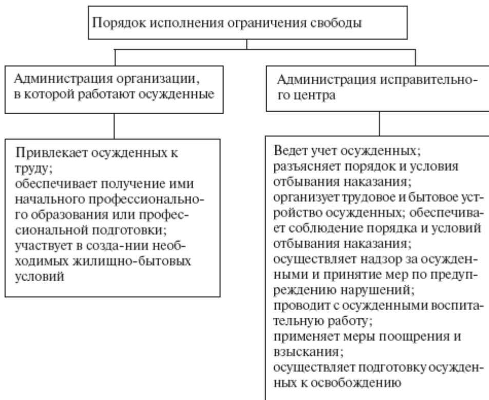
Рис. 6. Порядок исполнения ограничения свободы

Порядок исполнения указанных обязанностей определяется УИК РФ, Положением об исправительном центре, которое разрабатывается и утверждается Правительством РФ, иными нормативными правовыми актами.