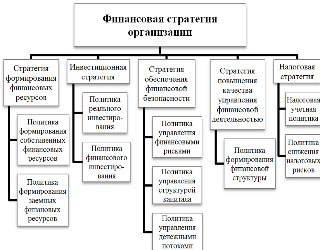
Рисунок – Компоненты финансовой стратегии организации

Задание 7. Опишите, чем, на Ваш взгляд, характеризуется каждый из компонентов финансовой стратегии организации (рисунок).